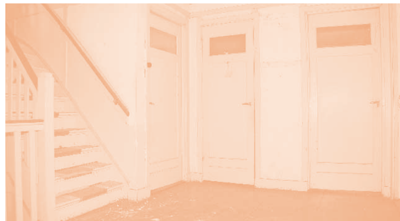
De hal op de verdieping met links de trap naar de vloering.