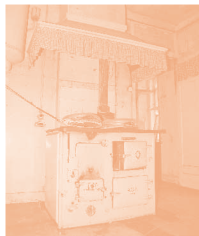
Het AGA-fornuis in de keuken

(of salon). Tussen de drie woonruimten zitten twee paar schuifdeuren. In de keuken bevindt zich naast een bellenbord voor de bediening een aanrecht met eterniet aanrechtblad en daarin een geëmailleerde ijzeren gootsteen (net als de badkuip in het gebouw geleverd door de DRU in Ulft). Het belangrijkste interieurstuk in de keuken is het AGA-fornuis met twee kookpitten en twee ovendelen van het in 1939