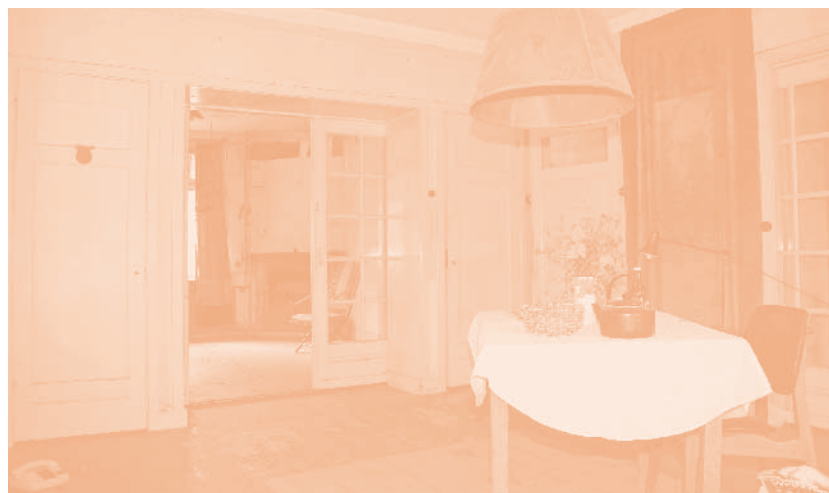
De woonkamer met achter de schuifdeuren de zitkamer.

Begin 1939 werd het initiatief genomen tot de oprichting van een Centraal Vluchtelingenkamp voor de opvang van uit Duitsland gevluchte Joden. Dit