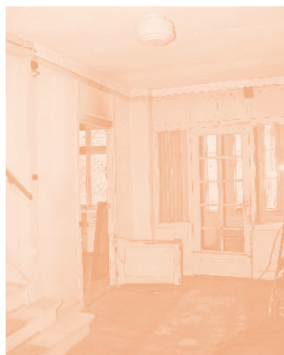
Hal beneden met links keukentoeegang

Op een kruispunt in de Drentse bossen staat een groot, maar nogal haveloos uitzienend, houten huis als overblijfsel van het Centraal Vluchtelingenkamp Westerbork. Deze voormalige commandantwoning is als door een toeval bewaard gebleven en daardoor een stille getuige van een schuldig verleden. Het zou eigenlijk hetzelfde lot van de andere opstallen in de buurt hebben moeten ondergaan, maar omdat het in 1994 tot rijksmonument was verklaard, bleef sloop achterwege. Kort na 2007 kwam het huis in het bezit van het Herinneringscentrum Kamp Westerbork. Nu beraadt men zich er over hoe dit gebouw in de toekomst op zinnige wijze te benutten is. In zijn huidige staat is het gebouw een tijdscapsule waarvan fotograaf Sake Elzinga in 2009 een prachtige fotoreportage heeft gemaakt. In dezelfde tijd heeft Bureau voor Bouwhistorie en Architectuurgeschiedenis (BBA) een onderzoek naar dit bijzondere pand gedaan.