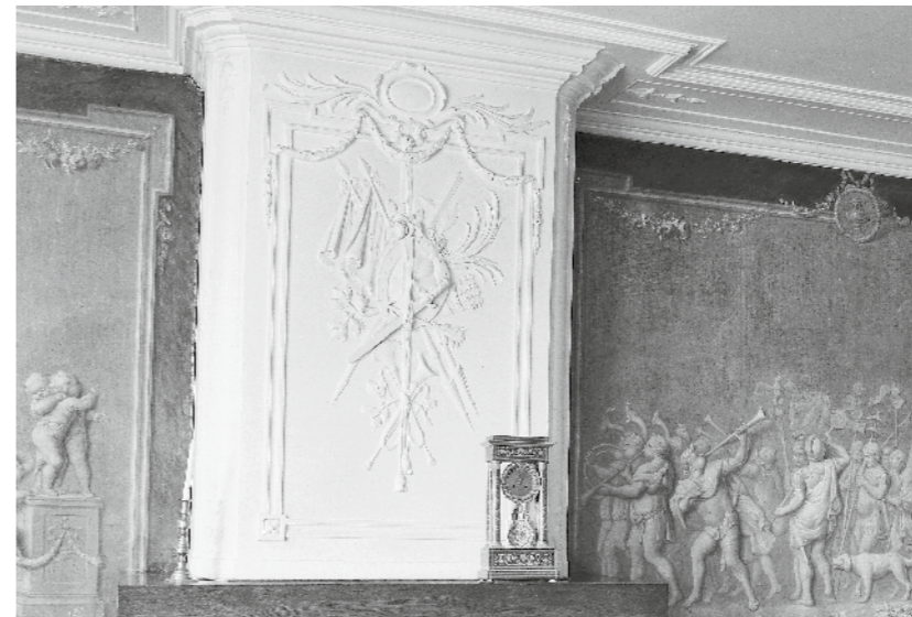
Wapentrofee met SPQT

triumferende stoet te wachten. Ook is hier de personificatie van de Tiber afgebeeld met de hoorn des overvloeds en de zogende wolvin, het symbool van de stad Rome. Boven de stadspoort hangen twee vaandels met het opschrift SPQR (Senatus PopulusQue Romanus). Het bovendeurstuk toont het portret van de Romeinse generaal en profiel, geflankeerd door adelaars en putti met lauweromwonden roedenbundels met bijl, pijlbundel ('fasces'), Mercuriusstaf, vruchten en gewassen. Op het geschilderde wandvlak op de linkerwand, rechtsonder dichtbij de vensterwand, heeft de schilder zijn signatuur en datering achtergelaten: AND. WARMOES PINXIT Ao 1778. Van deze schil-