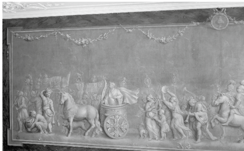
De Romeinse triomftocht, foto's collectie Rijksdienst voor het Cultureel Erfgoed

dieping. Deze kamer, ook wel de grote achterzaal genoemd, heeft op drie van de vier wanden een groot geschilderd linnenbehangsel van in totaal bijna twintig meter lengte. Dit behangsel is een zogeheten grisaille, een reliëfachtige schildering in grijze, witte en zwarte tinten. De voorstelling is omkaderd